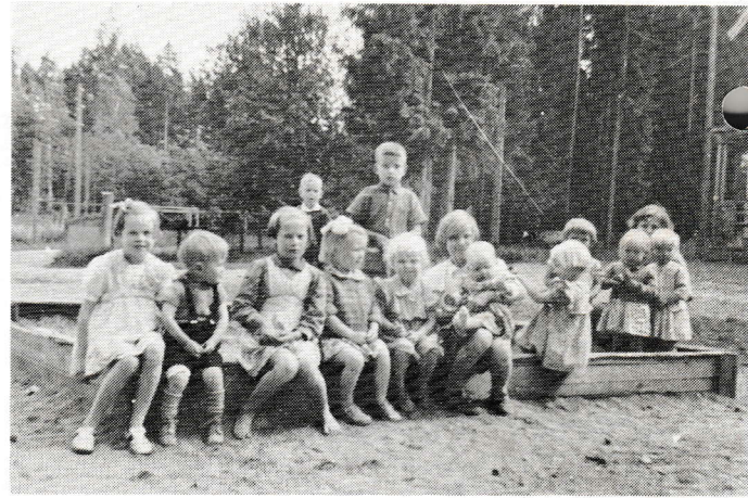
Hongiston lapsia 1953. Kuvassa tulevia insinöörejä, opettajia, ammattimiehiä, taiteilijoita, konttoristeja.