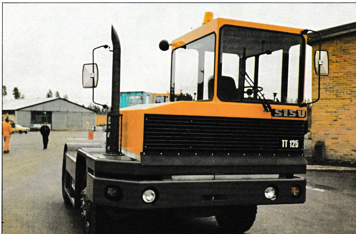
Hämeenlinnan tehtaan uusinta tuotantoa, terminaalitraktori TT-125

VUOTTA AUTOTEOLLISUUTTA HÄMEENLINNASSA 13.4.1983